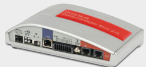
/ Fronius Datamanager Box 2.0

/ Komfortabler Support da der Fronius Datamanager den Wechselrichter direkt mit Fronius Solar.web verbindet.