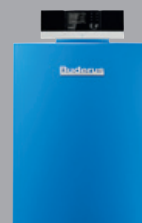
Logano plus GB212