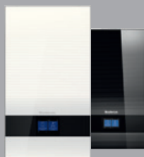
Logamax plus GB182i ab V2