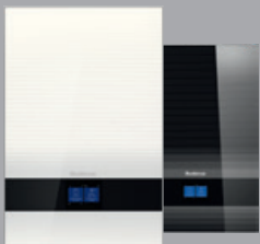
Logamax plus GB192i ab V2