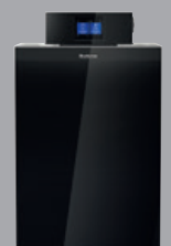
Logano plus KB192i / KB195i