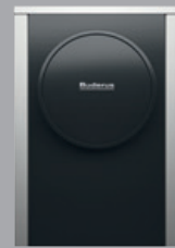
WLW196i-6 A H S+