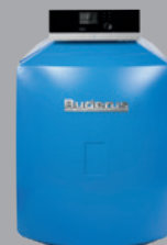
Logano plus GB125 ab V3