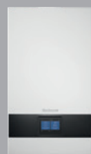
Logamax plus GB172i ab V2