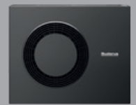
WLW-10/-12 MB A H