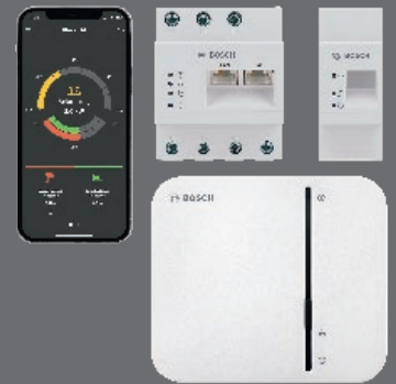
Bosch Smart Home Controller

Wichtige Informationen schnell parat: Visualisierung von aktueller PV-Produktion, Ladezustand der Batterie und des Trinkwarmwasserspeichers sowie des aktuellen Systemstatus.