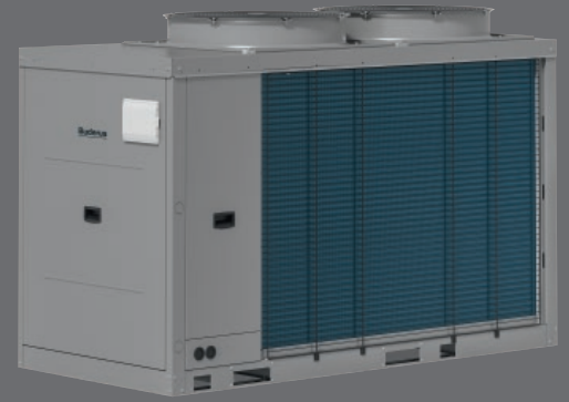
Gerätevariante mit 31 kW bis 41 kW Leistung

Bosch Thermotechnik GmbH, Buderus Deutschland, Bereich SBC, 35573 Wetzlar www.buderus.de, info@buderus.de, Tel. (06441) 418-1020