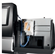
Logamatic 5000 mit Modul und Web-Gateway