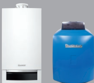
Geräte ohne integrierte Internet-Schnittstelle

Sie können mit nahezu allen aktuellen Buderus Wärmepumpen online gehen. Geräte ohne integrierte Internet-Schnittstelle mit der Systembedieneinheit Logamatic RC300 / RC310 oder Logamatic HMC300 / 310 (z. B. Logamax plus GB172 oder Logano plus GB125) und auch ältere, bereits installierte Geräte ab Baujahr 2003 mit der Logamatic RC30 / RC35 können in Verbindung mit der Internet-Schnittstelle Logamatic web KM200 bequem online gehen. Neue Wärmepumpen (z. B. Logano plus KB195i, Logatherm WLW196i AR oder