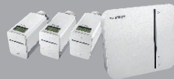
Bosch Smart Home