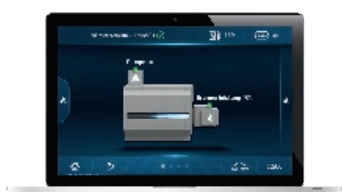
Control Center CommercialPLUS

Das Buderus Konnektivitätskonzept macht die Steuerung und Regelung auch mittlerer und großer gewerblicher Anlagen so professionell, komfortabel und sicher wie nie zuvor. Denn als Systemanbieter bietet Buderus nicht nur maximal effiziente Heizsysteme, sondern auch das perfekte Zusammenspiel zwischen Heizsystemen, Regelungs-Hardware und Regelungs-Software.