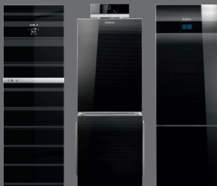
Geräte mit integrierter Internet-Schnittstelle